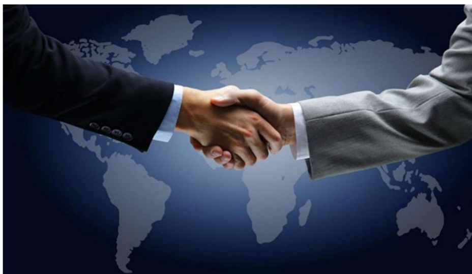
2024-es év második félévben induló képzési sorozat képzési naptára

A képzéshez csatlakozás feltétele a képző intézmény által összeállított B2-es szintű szintfelmérő legalább 60 %-os teljesítése, továbbá a képzésben résztvevőknek min. B2 szintű idegen nyelvű írás- és beszédképességgel kell rendelkezniük, mivel a témakörök taglalása és a szakmai kommunikációs készségek fejlesztése idegen ( angol, német, francia, spanyol, olasz vagy orosz ) nyelven zajlik.